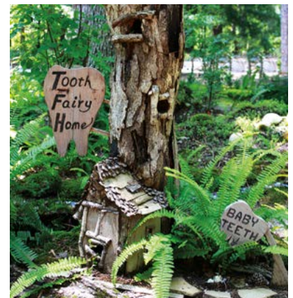
Leuk voor op het schoolplein of in de tuin.

Bij meisjes spreken elfjes wellicht nog meer tot de verbeelding dan kabouters: de kleine wezentjes met doorzichtige vleugels die voor de bloemen zorgen en met vlinders en insecten praten. Een typisch Engels gebruik is de Fairy Tea Party als kinderfeestje.