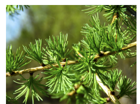
Legio naalden van een lariks