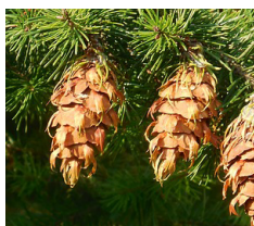
Kegels met 'tongetjes' van een douglasspar