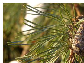
Duo naalden van een den