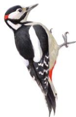
Grote bonte specht