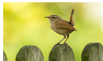
De winterkoning heeft altijd zijn staartje omhoog