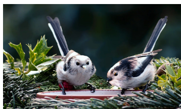
De staartmees heeft een opvallend lange staart