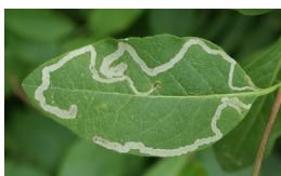
Gangetjes van bladmineerders.