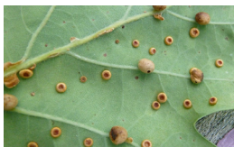
Galletjes veroorzaakt door een galwesp of galmug

Bevestig een 'waslijn' tussen 2 bomen. Hang met wasknijpers voorzichtig alle gevonden rare blaadjes aan de waslijn als tentoonstelling.