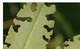
Aangevreten blad door een kever