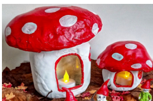
Kabouterhuisjes met een ledichtje erin

Na de wandeling kunnen de kinderen zelf een kabouterhuisje knutselen. Neem een leeg jampotje met de opening naar beneden. Teken er een deur en raampje op, de kinderen verven de rest van het potje wit (bv met gesso, dat hecht op glas). Vorm de hoed van aluminiumfolie en laat bekleden met papier maché, of kies voor klei of zoutdeeg. Als het droog is kan de hoed rood geverfd worden met witte stippen. Plaats een ledichtje onder het potje. Er schijnt nu een gezellig lichtje door de glazen raampjes.