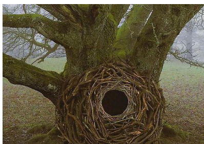
Drie land art kunstwerken van Andy Goldsworthy

Wie er oog voor heeft kan genieten van de soms adembenemende schoonheid van de natuur. Deze schoonheid kun je vinden in een prachtig vergezicht, een kleurrijke zonsondergang, of in een ontmoeting met een eeuwenoude beuk. Schoonheid zit ook in het kleine, zoals een prachtig gekleurd herfstblad of een spinnenweb met dauwdruppels. De schoonheid van de natuur heeft kunstenaars al eeuwenlang geïnspireerd. 'Land art' is de ultieme vorm van interactie tussen kunstenaar en natuur waarbij de kunst een onderdeel uitmaakt van het landschap en waarbij gebruik wordt gemaakt van materialen uit de natuur. De vergankelijkheid van het kunstwerk, waarbij de natuur het werk van de kunstenaar als het ware overneemt is een essentieel gegeven van deze kunstvorm.