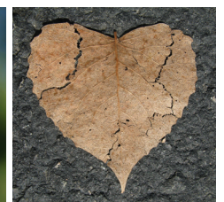
Gebroken hart herfstblad