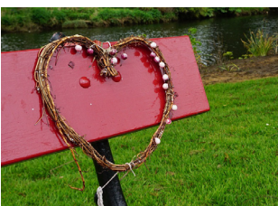
Maak zelf een hart met twijgjes en ijzerdraad