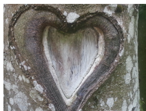
Hart in een boom