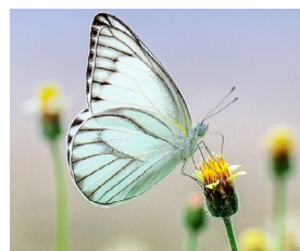
Vlinders ruiken met hun antennes en proeven met hun pootjes.