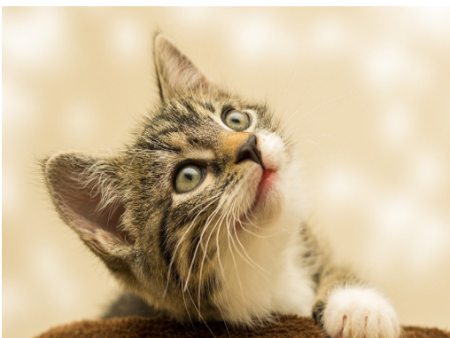
Katten voelen met hun snorharen.

Mensen hebben een gezicht met twee ogen, een neus, mond en twee flaporen aan de zijkant van ons hoofd. Bij zoogdieren is dat over het algemeen vergelijkbaar, alleen noemen we de neus een snuit en de mond een bek. Een vogelbek noemen we een snavel, vogels hebben geen tanden. In plaats van een neus en flaporen hebben vogels onopvallende neusgaten en oorgaten. Bij een slak zitten de 2 ogen op steeltjes, veel spinnensoorten hebben maar liefst 8 ogen. Een regenworm heeft nauwelijks een gezicht, het is moeilijk te zien of je naar zijn mondje (ingang) of zijn kontje (uitgang) kijkt. De zintuigen van dieren zitten soms op een andere plek dan bij mensen. Katten voelen met hun snorharen. Vlinders ruiken met hun antennes en proeven met hun poten. Antennes bij insecten kunnen dienen om te voelen, ruiken, proeven en/of om te horen.