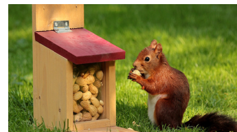
Eekhoorns zijn dol op noten.