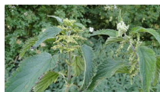
Witte dovenetel met bloemen

Brandnetel met bloem: linker mannelijk rechter vrouwelijk